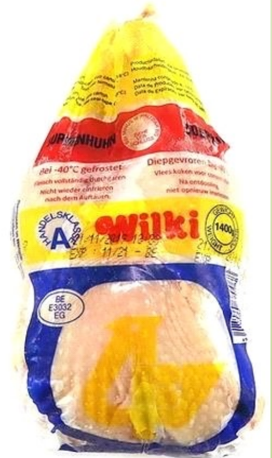
WILKI POULET DURE HALAL 1200G PRIX DE VENTE HT