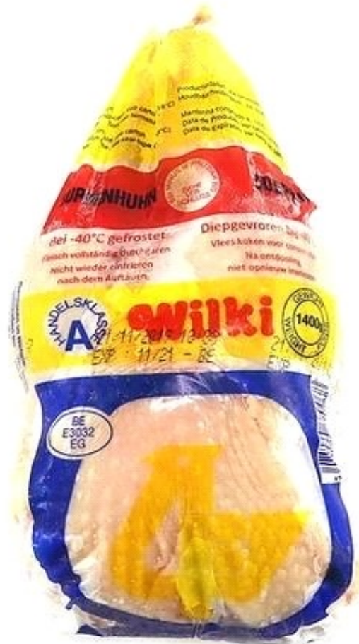
WILKI POULET DURE HALAL 1300G PRIX DE VENTE HT